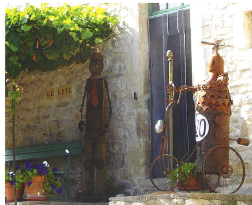
JOSÈF KARÔM artiste singulier

A ncien bouquiniste, c'est la découverte des illustrations d'un ouvrage médical traitant d'obstétrique neurologique qui l'a un jour entraîné dans les méandres de la création. Pourquoi a-t-il découpé ces images pour les recoller ce jour-là et pourquoi n'a-t-il plus cessé de réaliser ses compositions à base de collages et d'assemblages ?